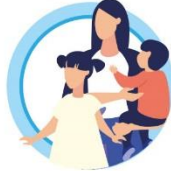
У ДЕТЕЙ ДО 5 ЛЕТ