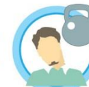
ОБЩЕЕ НЕДОМОГАНИЕ, СЛАБОСТЬ