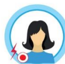
ЛОМОТА В МЫШЦАХ И СУСТАВАХ