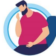
У ЛИЦ, ИМЕЮЩИХ ХРОНИЧЕСКИЕ ЗАБОЛЕВАНИЯ