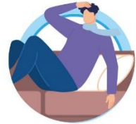
У ЛИЦ С ОСЛАБЛЕННОЙ ИММУННОЙ СИСТЕМОЙ