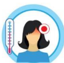
РЕЗКИЙ ПОДЪЕМ ТЕМПЕРАТУРЫ ТЕЛА И ОЗНОБ