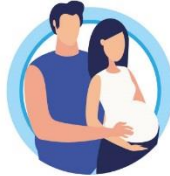
У БЕРЕМЕННЫХ ЖЕНЩИН