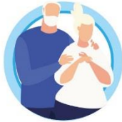
У ПОЖИЛЫХ ЛЮДЕЙ СТАРШЕ 65 ЛЕТ

РИСК ТЯЖЕЛОГО ТЕЧЕНИЯ ГРИППА И ОРВИ ЗНАЧИТЕЛЬНО ВЫШЕ: