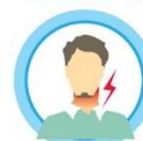
БОЛЬ, ПЕРШЕНИЕ В ГОРЛЕ